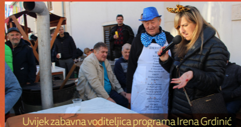
Uvijek zabavna voditeljica programa Irena Grdinić