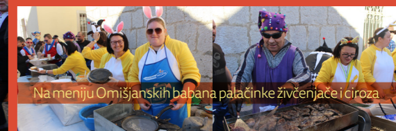
Na meniju Omišaljskih babana palačinke živčenja i ciroza