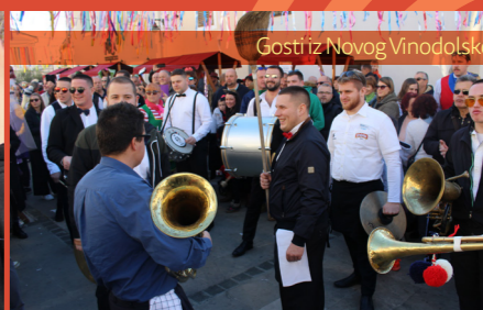
Gosti iz Novog Vinodolskog