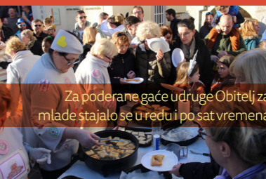
Za poderane gaće udruge Obitelj za mlade stajalo se u redu i po sat vremena