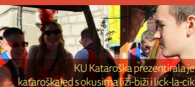
KU Kataroška prezentirala je kataroškaled s okusima lži-biži i lick-la-cik