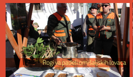
Rogi va padeli omišaljskih lovaca