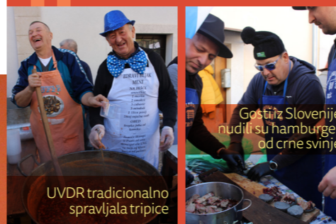
Gosti iz Slovenije nudili su hamburger od crne svinje

– Zahvaljujem svim sudionicima 14. Bljak festa koji su pripremili preko pet tisuća porcija, a rekordni broj ekipa koje su ove godine kuhale nadmašio je sva očekivanja! Manifestacija traje već 14 godina i iz godine u godinu raste u svakom smislu pa sa sigurnošću možemo reći da je ovo jedna od značajnijih gastro manifestacija čiji je cilj promocija pučke gastronomske baštine našeg kraja. Gastronomija je jedan od najzanimljivijih načina prezentacije lokalnih običaja i tradicije, a kad tome pridodamo da se održava u sklopu Mesopusta, rezultat je prepuna omišaljska Placa i pregršt zadovoljnih posjetitelja, poručila je Andrea Orlić Čutul, direktorica TZO Omišalj. (E.J.)