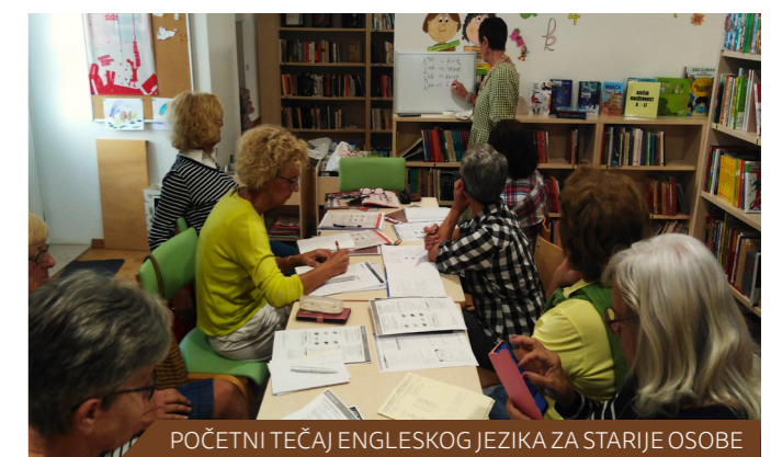
POČETNI TEČAJ ENGLSKOG JEZIKA ZA STARIJE OSOBE