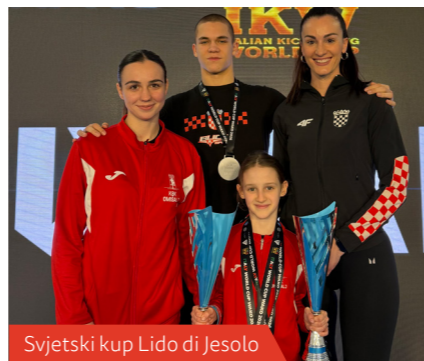
Svjetski kup Lido di Jesolo

kluba. KBK Omišalj zauzeo je visoko 7. mjesto u ukupnom poretku.