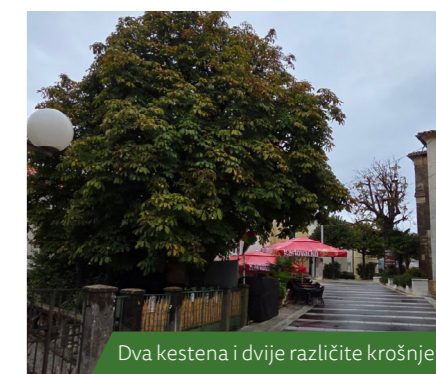
Dva kestena i dvije različite krošnje

Na istoj je lokaciji, nakon uklanjanja starog, posađen novi, mladi i zdravi kesten, kako bi se očuvala tradicija rasta ovog stabla koje je godina-