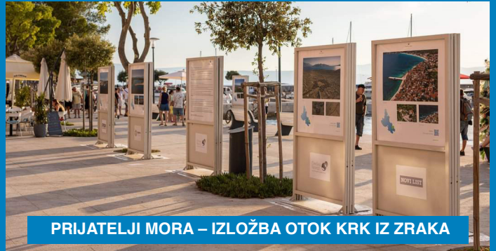
PRIJATELJI MORA – IZLOŽBA OTOK KRK IZ ZRAKA