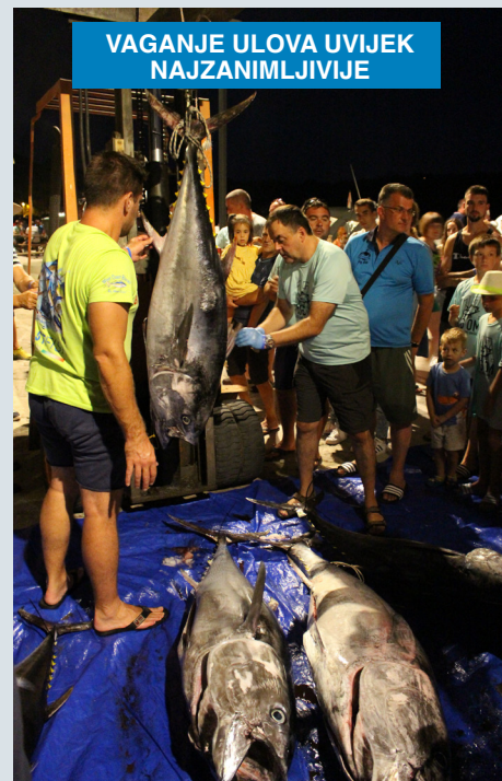
VAGANJE ULOVA UVIJEK NAJZANIMLJIVJE