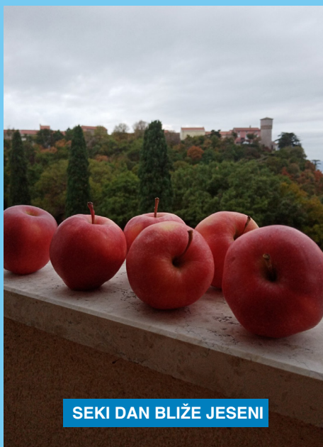
SEKI DAN BLIŽE JESENI

na kući, jedna gerja od druge. Če ti šoldi i pohlepa more učinit od čovika! Kroz glavu mi pasuje izraelska poslovica: „Oci jedoše kiselo grožđe, sinovima trnu zubi!“ Nakon te vele tugi, vero sem bila kuntenta kada sem se vernula va moj lipi Omišej ki, ruku na srce, još vavik ni tuliko ruvinan. Na moju velu žalost, veselje ni peno duralo. Dan za tim, šla sem do Konzuma i imam ča vidit. Prvo će sem pomislela: Sva srića da je naš veli slikar Oton Gliha pokojni, aš da vidi ovo će ja sada gjedam, denes bi sopeta umer. Na mesto naših lipih gromač, sada gjedam va dermun ograjen s meter visokim zidom. Još ne morem verovat da se denes more dobit dozvola za takovo svetogerje. Do