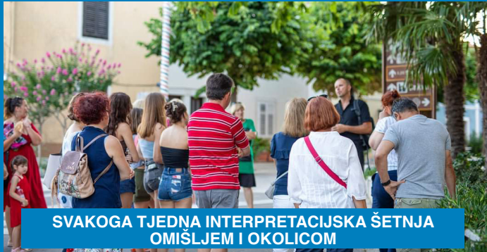
SVAKOGA TJEDNA INTERPRETACIJSKA ŠETNJA OMIŠLJEM I OKOLICOM

Njivice i Omišalj ovoga su ljeta živjeli punim plućima. Gotovo da nije bilo dana u posljednja tri mjeseca u kojem nije bilo nekog kulturnog, sportskog ili zabavnog događaja, manifestacije, projekta... Kako bi Omišljani i Njivičari uživali u dramskim predstavama, glazbi, izložbama i zabavi, baš kao i njihovi dragi gosti pristigli na odmor i svi koji svoje stalne adrese na nekoliko mjeseci zamijene njivičkom ili omišaljskom, sva su događanja za njih pomno osmislili i realizirali djelatnici Općine i Turističke zajednice Općine Omišalj. Ovogodišnje „Ljeto“ osmislili su s ciljem da probudi optimizam i veselje, a raznovrsni program ispuni tople ljetne noći melodijom, plesom i kulturnim sadržajem.