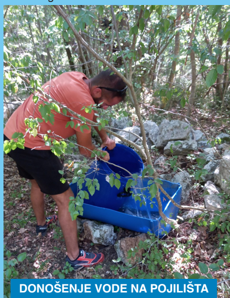
DONOŠENJE VODE NA POJILIŠTA

Ovo je ljeto bilo izuzetno toplo, s dugim sušnim razdobljima. I nama ljudima teško podnošljivo sa svim klimatizacijskim sistemima i vodom koje još uvijek ima u dovoljnim količinama. Problem se javlja u prirodi jer isušuju prirodna i umjetna pojilišta kojima se služe životinje. Njima u pomoć i ove su godine izašli lovci Lovačkog društva „Šljuka 1924“ iz Omišlja i članovi Dobrovoljnog vatrogasnog društva „Njivice“. Oni su u nekoliko navrata čistili lokve i pojilišta te nosili vodu u lovište. Hvala im i na ovom angažmanu.