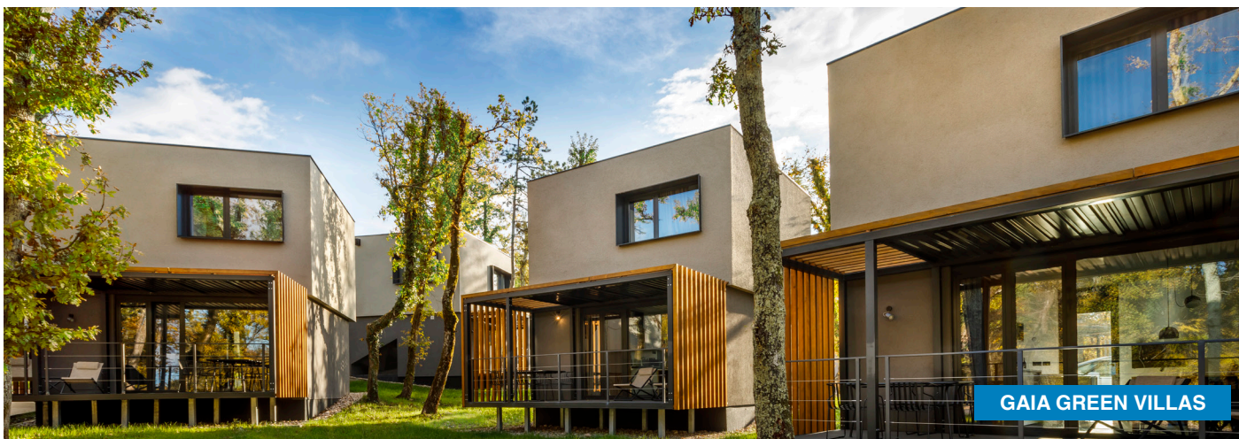
GAIA GREEN VILLAS