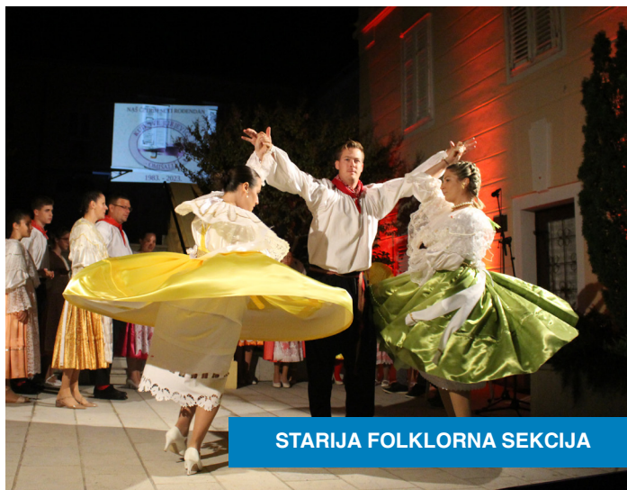
STARIJA FOLKLORNA SEKCIJA