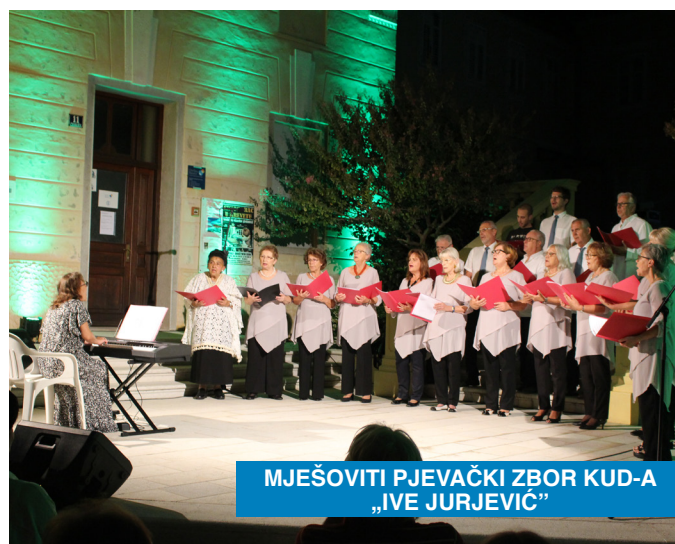
MJEŠOVITI PJEVAČKI ZBOR KUD-A „IVE JURJEVIĆ“