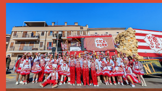
Omišaljski babani kao "Cock Porn"