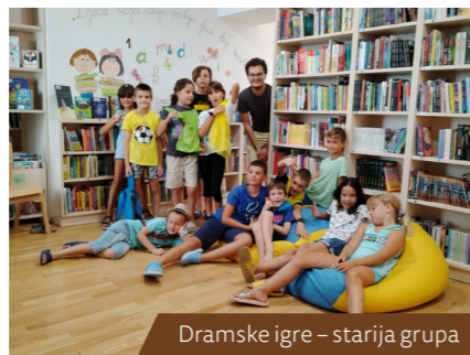
Dramske igre – starija grupa