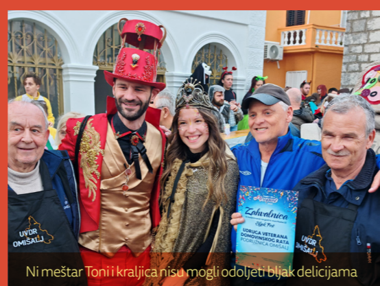
Ni meštar Toni i kraljica nisu mogli odoljeti bljak delicijama