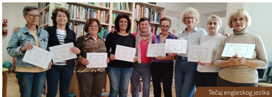
Tečaj engleskog jezika

ili 57 posto. Upisom u Knjižnicu „Vid Omišljanin“ svi članovi mogu koristiti i sve druge odjele i ogranke Gradske knjižnice Rijeka i obrnuto.