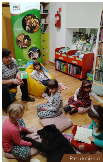
Pas u knjižnici

Sa svim redovnim aktivnostima nastavlja se i dalje u 2025. godini, a o povremenim i izvanrednim programima svi će korisnici biti na vrijeme obaviješteni. (B.Č.)